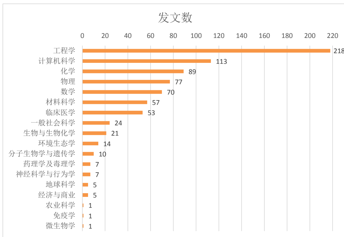
表 5-1 各学院高被引论文数统计