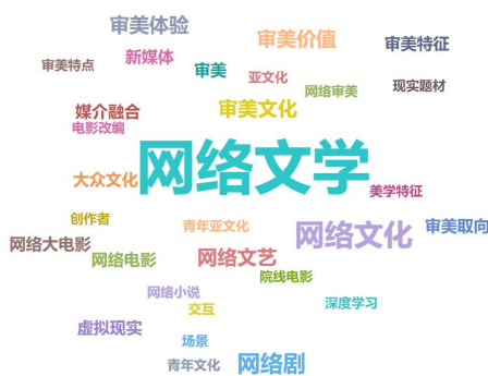
图 1-2 “中国网络文化审美”关键词共现分析

对“中国网络文化审美”关键词进行共现分析，发现国内的研究热点主要集中在网络文化、审美文化、网络文学、审美价值、审美教育、审美、大众文化、网络剧、审美体验、审美取向等方向（图 1-1），多发表在《电影文学》《当代电视》《中国文艺评论》《中州学刊》《社会科学辑刊》《艺术百家》等人文社科类核心期刊上（图 1-2）。