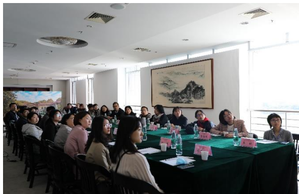
座谈会后，来访同仁参观了李文正图书馆。

会议交流环节，双方就智慧化图书馆软硬件建设、智能化设备设施选择、空间改造的经验等问题进行了深入的交流与讨论。